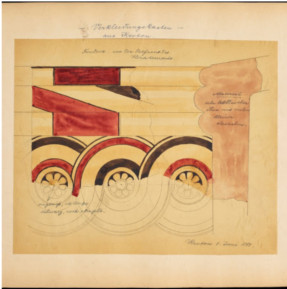
Dörpfeld, Wilhelm, Aquarelle Dörpfelds zu ital. Dachterakotten, 1881, Verkleidungskasten aus Kroton